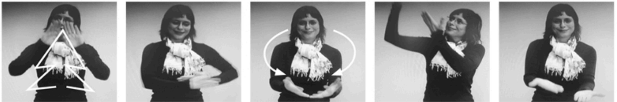
Weihnachtskind auf die Erde will.