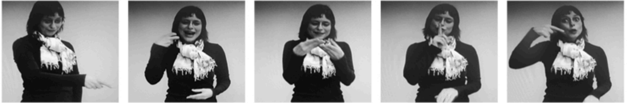
sie werden weiss und weich und still, weils